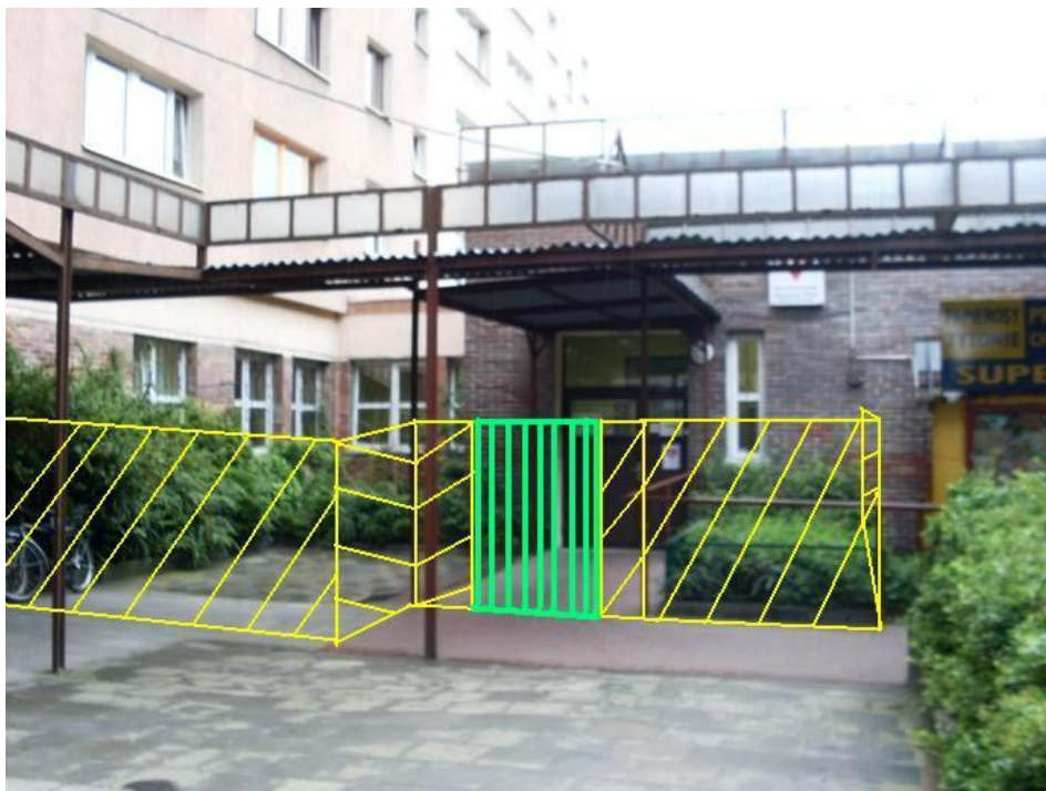
Rys. 1: Obszar objęty zamówieniem (prace przystosowawcze – utworzenie terenu przyjaznego podopiecznym)