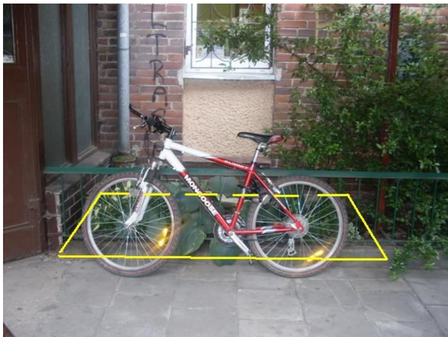
Rys. 2 Obszar objęty zamówieniem (prace przystosowawcze – utworzenie parkingu dla rowerów)